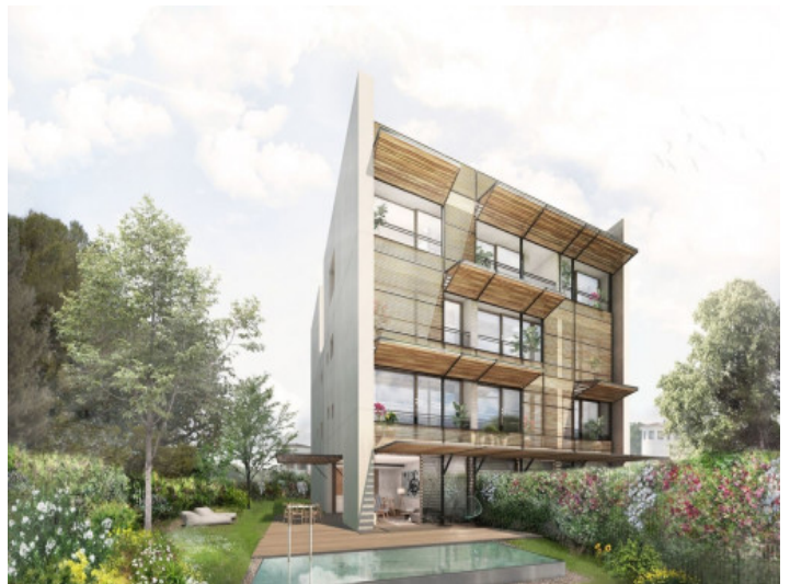
Exterior view of the building