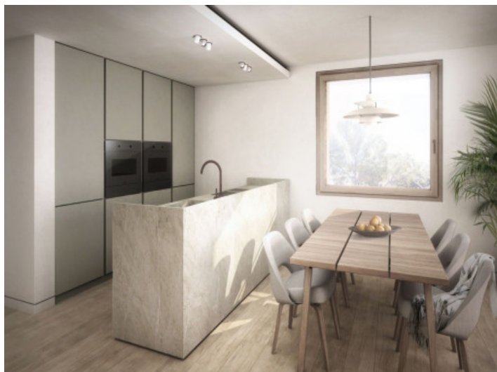
Fully equipped kitchen with cooking island