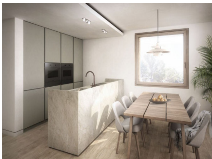
Fully equipped kitchen with cooking island