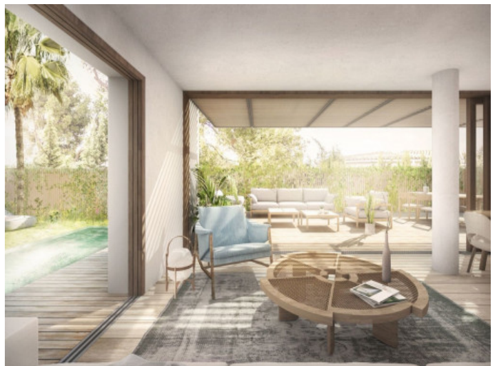
Light flooded living area

All information is correct to the best of our knowledge. Errors and prior sale excepted. This prospectus is purely for information purposes. Only the notarized deed of sale is legally binding.