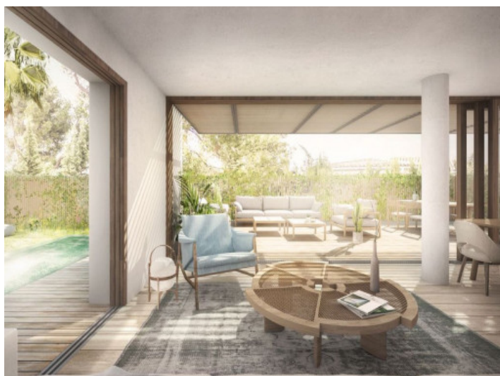
Open living area with access to the garden