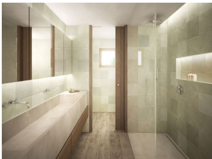
Noble bathroom en suite with walk-in shower