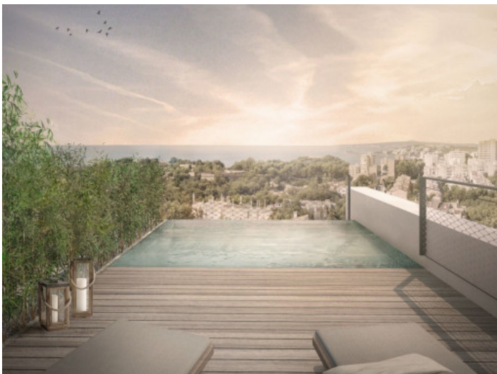
Picturesque roof top terrace with pool