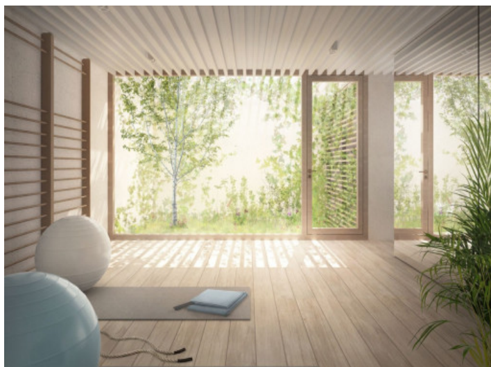
Fitness area with air condition