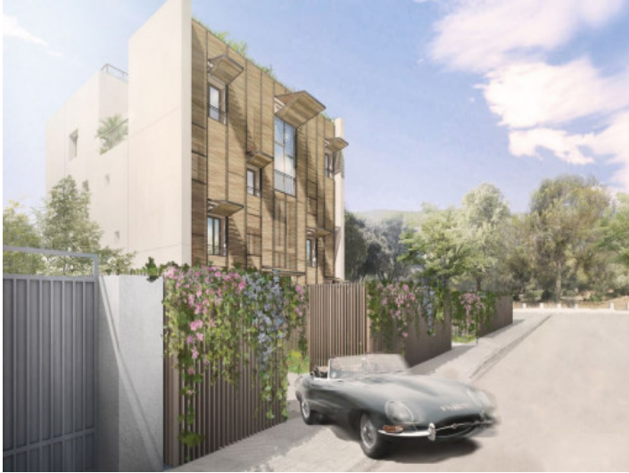
Iconic newly built apartment complex in Palma

VIVIENDA 0A PLANTA BAJO SUPERFICIE CONSTRUIDA: 101,40 m 2 SUPERFICIE TOTAL: 101,40 m 2 CANTIDAD: 1 UNIDAD / 1 UNIDAD / 1 UNIDAD