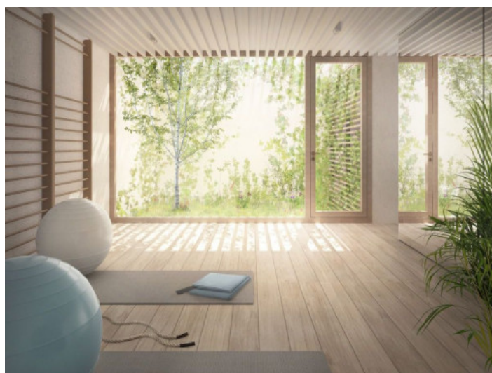
Airconditioned fitness area

All information is correct to the best of our knowledge. Errors and prior sale excepted. This prospectus is purely for information purposes. Only the notarized deed of sale is legally binding.