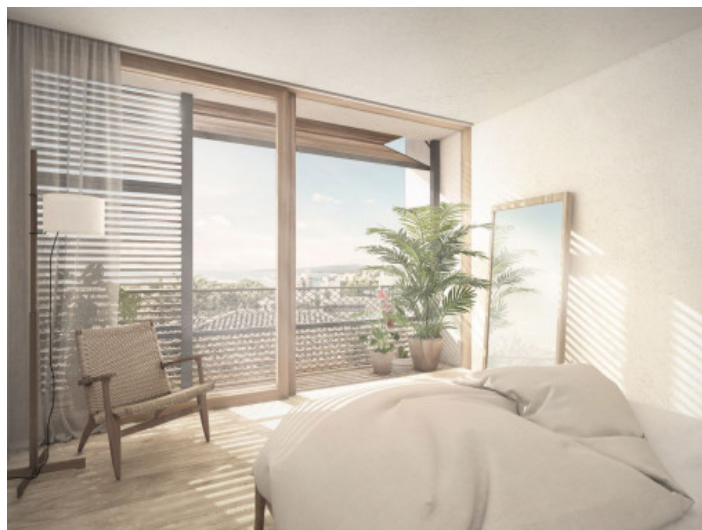
Spacious double bedroom