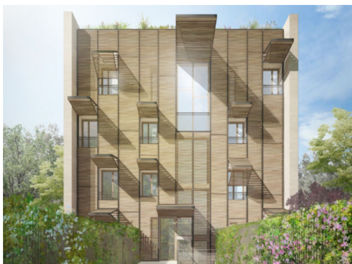
Exterior view of the complex