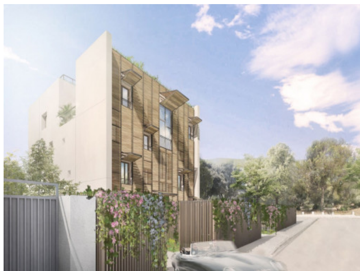
Exterior view from the street

All information is correct to the best of our knowledge. Errors and prior sale excepted. This prospectus is purely for information purposes. Only the notarized deed of sale is legally binding.