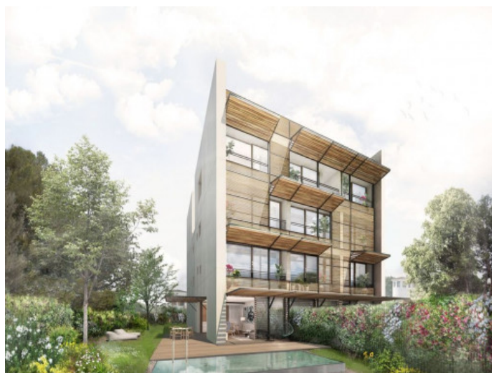
Alternative exterior view of the complex